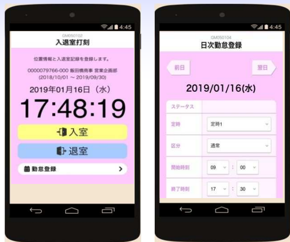
■モバイル版 打刻、日次勤怠登録画面イメージ

モバイル版の利用においては、派遣先企業様にて利用の有無を決定し、派遣先企業様よりHRstationサポートセンターへご連絡をください。モバイル勤怠利用権限を付与させていただきます。モバイル版の利用を希望される場合は、貴社HRstationご担当者様よりHRstationサポートセンターへご連絡をお願い致します。