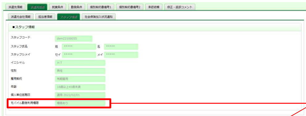
■派遣先情報登録 契約派遣先情報登録 派遣元情報 スタッフ情報タブ イメージ

“モバイル勤怠利用権限”項目追加 派遣会社が設定した権限の有無が表示されます。HRstationサポートセンターにてモバイル利用権限が付与されていない場合は、項目表示されません。