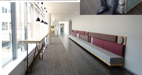
随所にリフレッシュスペースや面談コーナーがある