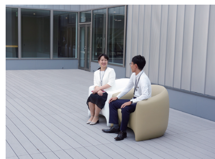
暖かな日はウッドデッキで談笑