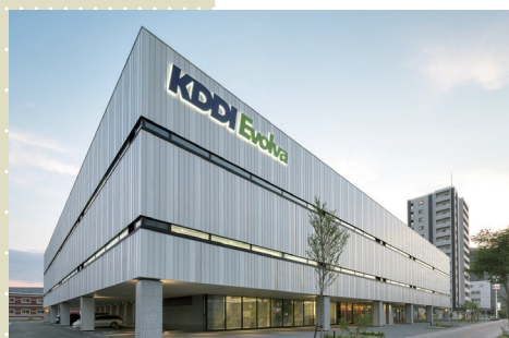
白石区東札幌に立地する札幌センターの外観

回廊に沿って左手に進み、ぐるりと廻ると厨房と社員カフェテリアがある。300席を用意。フル稼働時（約2000人）でも