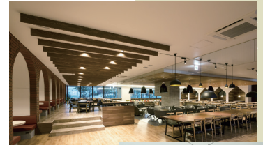
社員カフェテリア(別角度からの眺め)