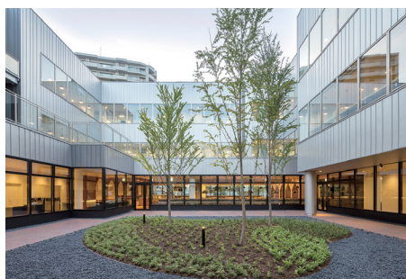
吹き抜けて開放的な中庭「カントレラ」はアイヌ語で“天空・風”