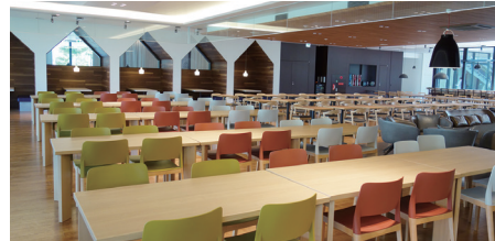
社員カフェテリア「ケラピリカ」はアイヌ語で“美味しい”。左手奥のガラスの向こうは採用センター「イコロ」(アイヌ語で“宝”)

運用室のカーペットや什器などにもこだわり。各業務のグループリーダーがコミュニケーターやSVの意見を聞き入れつつ選定。“みんなで作ったセンター”で