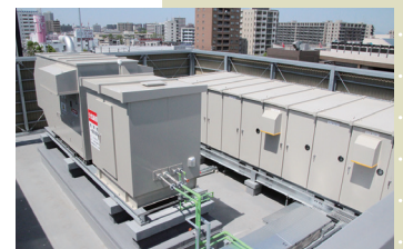
安定稼働のため、2系統受電や自家発電機を完備

保育園は地域枠で従業員以外も利用可能。子どもの入園と同時にママも入社となれば、まさに“つなぐ”の実現だ。また、同社は障害者雇用にも注力しており、現在は2名が中庭の手入れや施設内の清掃で勤務している。